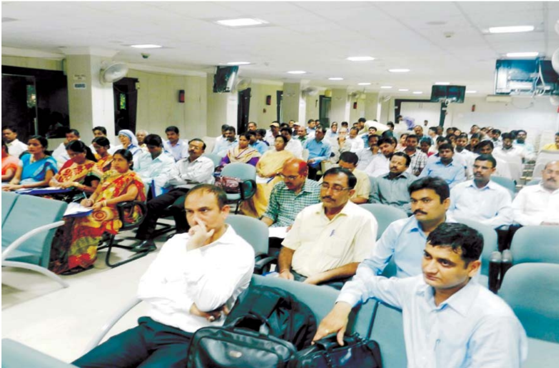
06 सितम्बर, 2013 को पटना, बिहार में आयोजित राज्य अभिविन्यास कार्यक्रम