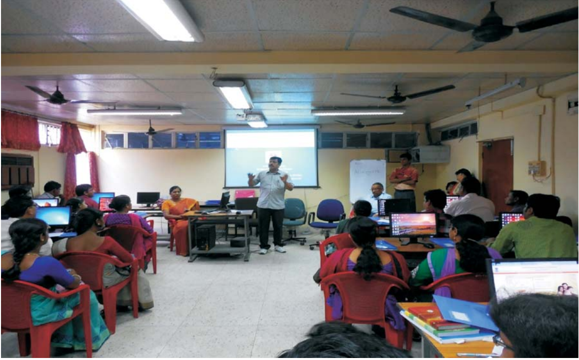
कोलकाता में केयरिंग्स पर व्यावहारिक प्रशिक्षण सत्र