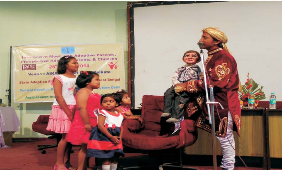
कोलकाता में दत्तक माता-पिता, भावी दत्तक माता-पिता (पीएपी) के साथ विचार-विमर्श बैठक के दौरान सांस्कृतिक कार्यक्रम