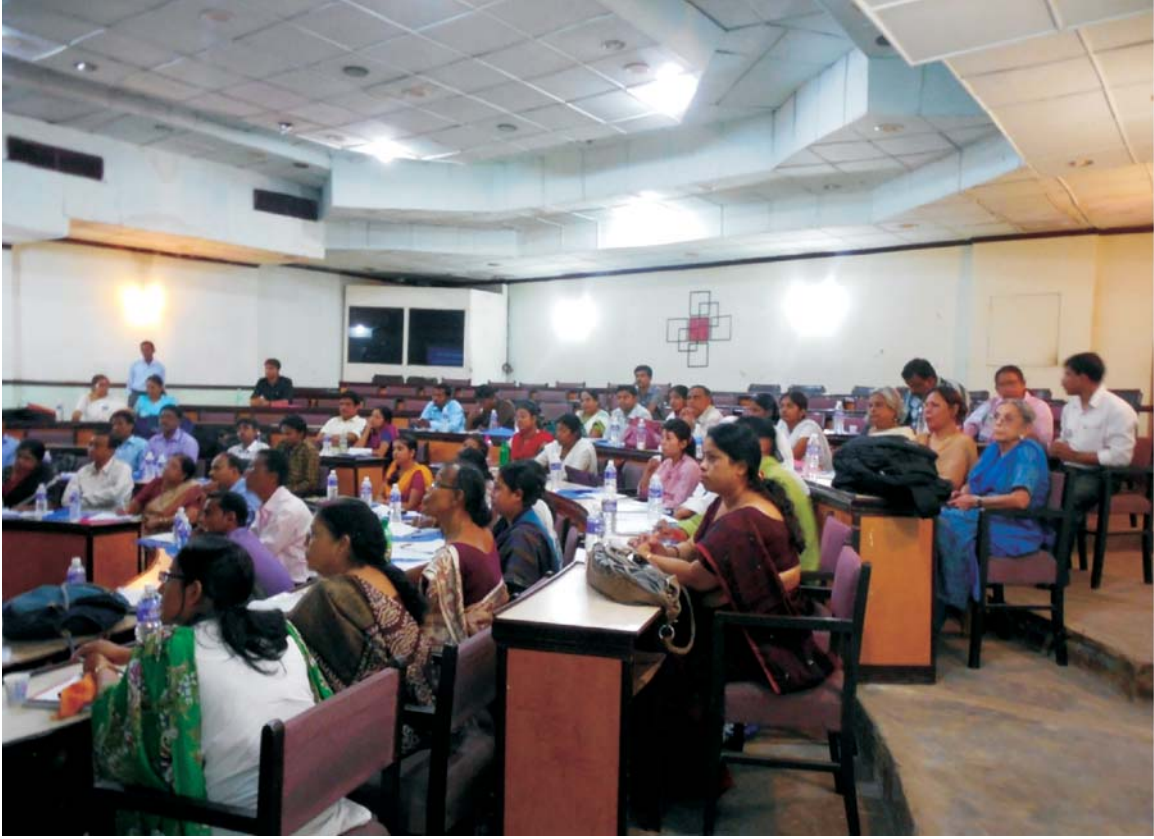
28 मार्च, 2014 को कोलकाता में आयोजित राज्य अभिविन्यास कार्यक्रम