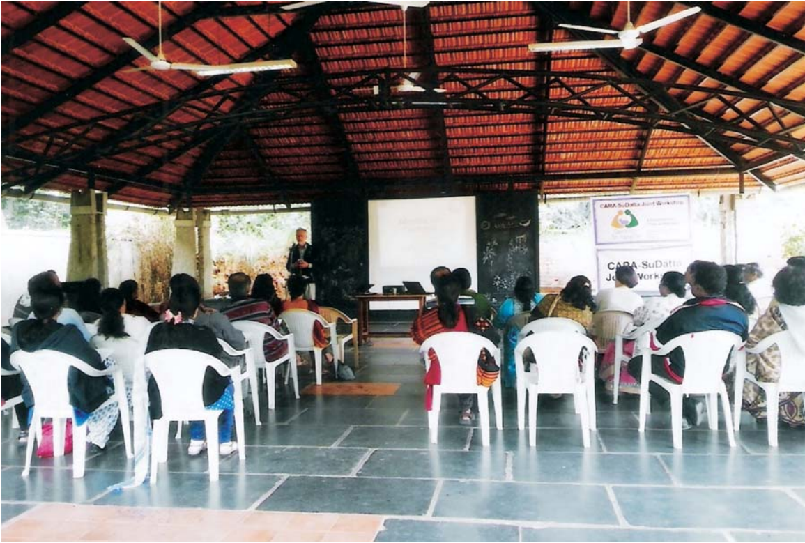
16 एवं 17 नवम्बर, 2013 को बैंगलुरु में आयोजित विचार-विमर्श बैठक के दौरान दत्तक माता-पिता/भावी दत्तक माता-पिता और बच्चे